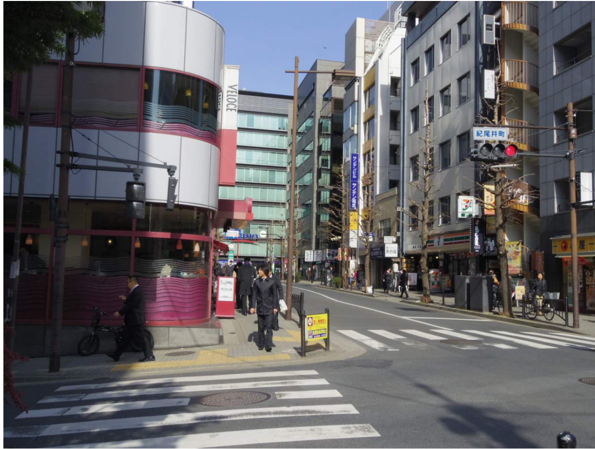
紀尾井町交差点、直進です。